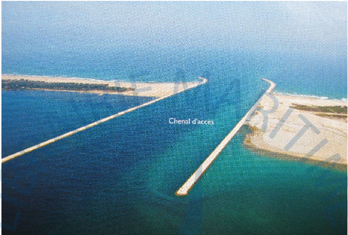
le chenal d'accès