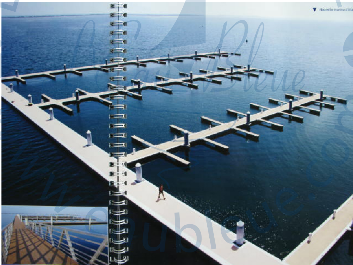
La nouvelle marina d'Atalayoun lors de son achèvement fin 2012.

Cette nouvelle marina offre toutes les commodités d'une marina moderne haut de gamme, et jouxte un parcours de golf de 18 trous. Elle sera dotée de grands hôtels ainsi que d'un ambitieux programme de développement immobilier dont la première tranche concerne 149 appartements en cours de construction aux abords de l'Académie de Golf, le long du quai principal, les boutiques, les terrasses des restaurants créent une ambiance toute estivale. Une deuxième marina (au sud) est prévue pour 2016.