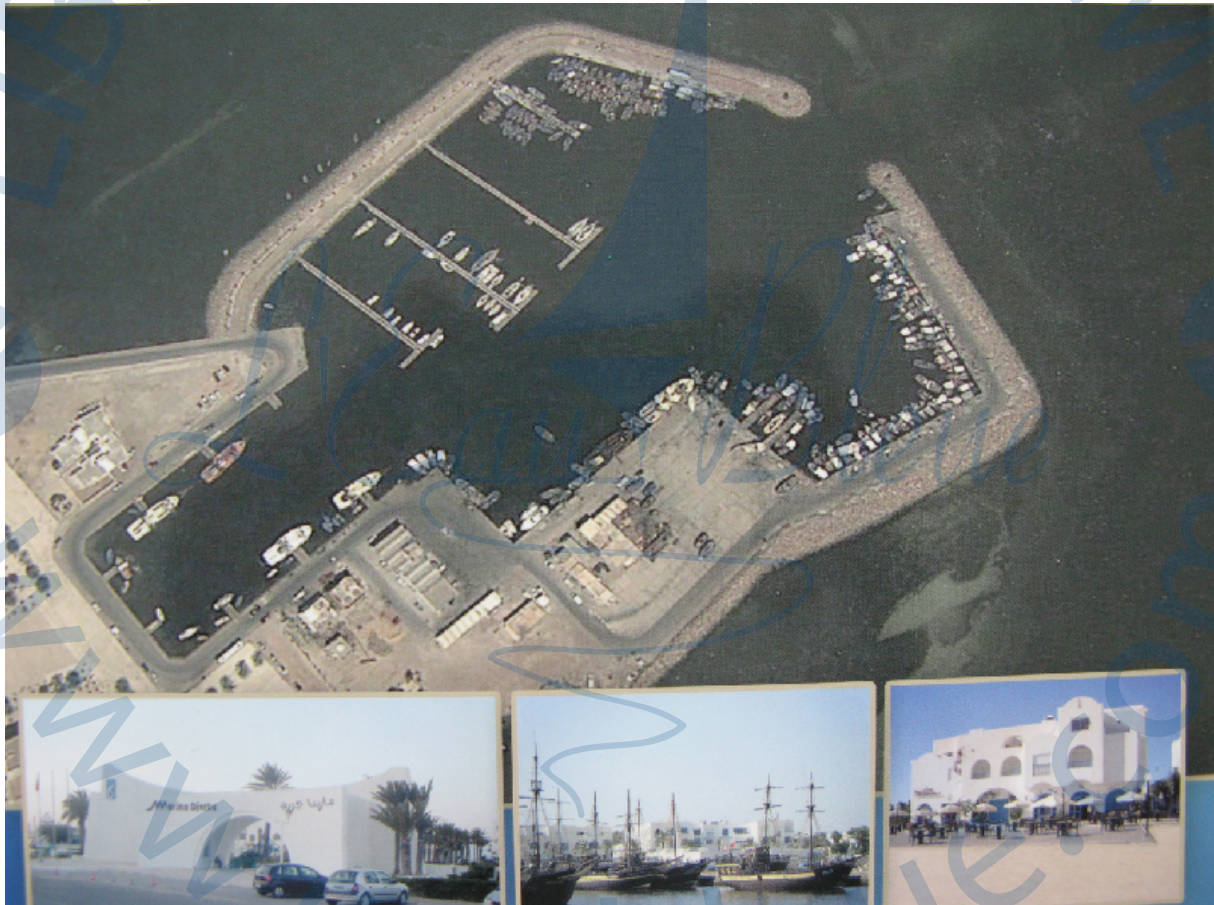
Vue aérienne du port d'Houmt Souk avec la marina sur la gauche

A terre un ensemble immobilier est en cours d'achèvement avec divers commerces dont restaurants, pizzeria, pharmacie, boulangerie-pâtisserie, cafés et tabacs, supérette, agence de voyage et location de voitures.