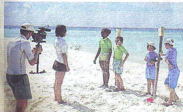
La famille a réalisé une fiction pour rassurer et donner des astuces aux parents et enfants qui voudraient l'imiter et partir une année entière en voyage.